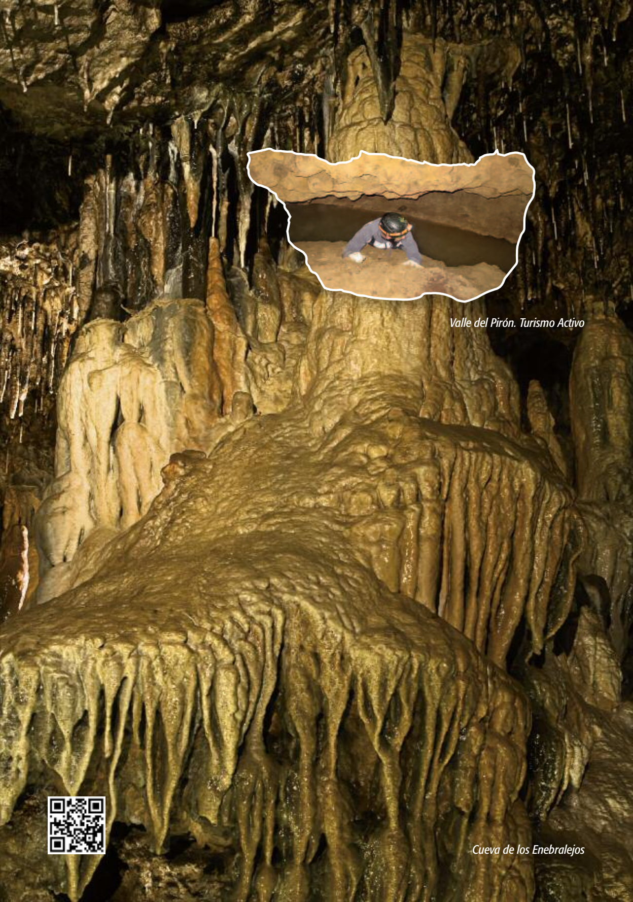
Valle del Pirón. Turismo Activo