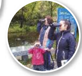
Tenada del Monte