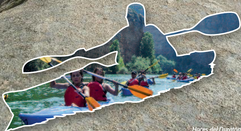
Hoces del Duratón