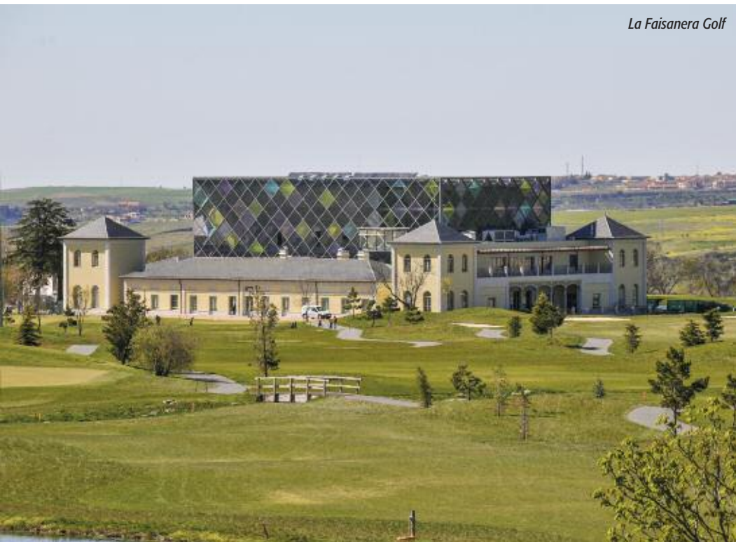
La Faisanera Golf