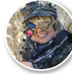
Campo Airsoft Caos